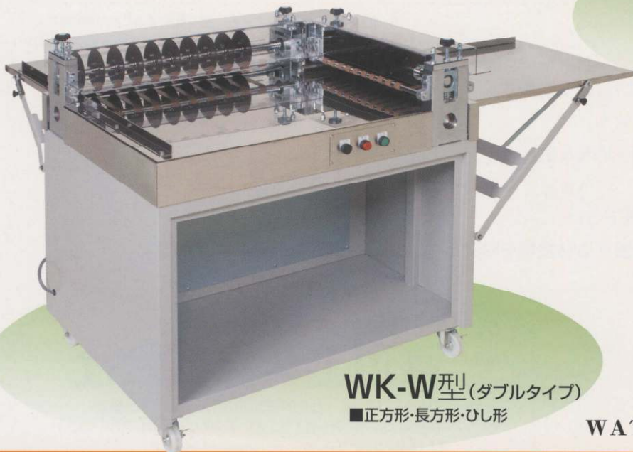
WK-W型 (ダブルタイプ) ■正方形・長方形・ひし形