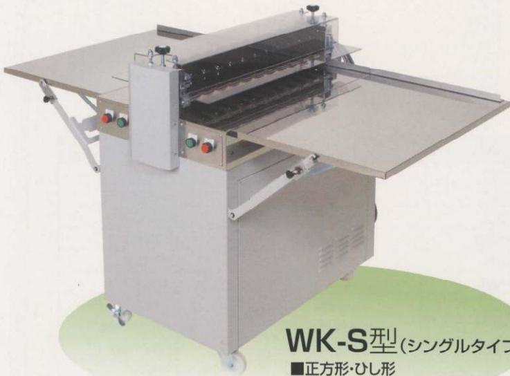
WK-S型 (シングルタイプ) ■正方形・ひし形