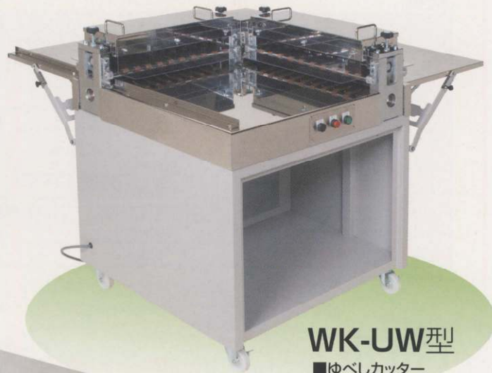
WK-UW型 ■ゆべしカッター ステンレスケース付 ゆべし、求肥、ラスク等の 生地切断に!